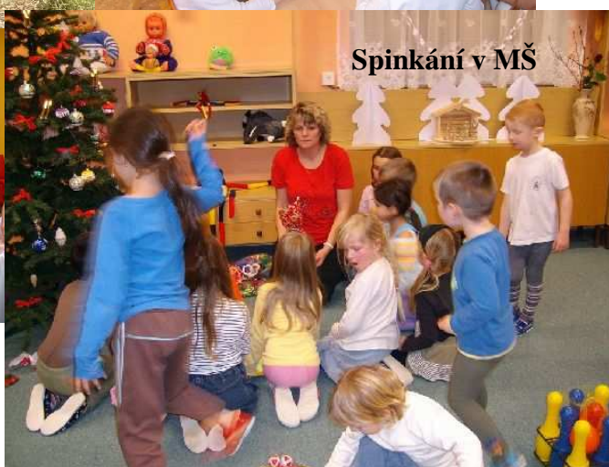
Spinkání v MŠ