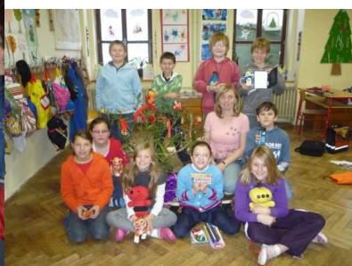
Vánoční besídky ve třídách