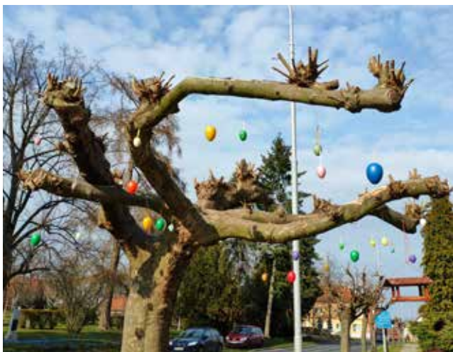
Vojtěch Václav Pour